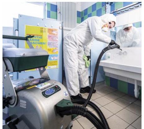
Der Blue Evolution S+ macht Schluss mit der Kontamination von Kontaktflächen.