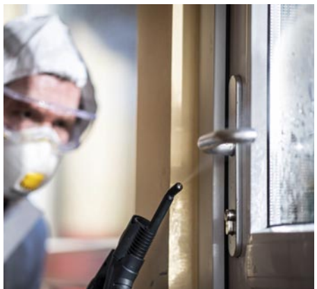
Der Blue Evolution S+ ist mit verschiedenen Aufsatzdüsen ausgestattet, sodass mit dem Gerät große Flächen wie schwer zugängliche Stellen optimal gereinigt werden können.