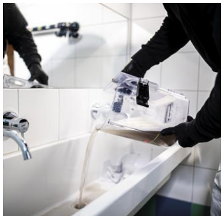
Bei Blue-Evolution landen die Schmutz- partikel im Wasserfilter.

Der Blue Evolution S+ und der Blue Evo- lution XL+ sind mit einem robusten Edel- stahl-Gehäuse und vier frei beweglichen Lenkrollen ausgestattet. Die Multifunkti- onsgeräte verfügen außerdem über ver- schiedene Aufsatzdüsen, und ihr Dampf- druck kann so reguliert werden, dass alle Oberflächen gründlich und schonend ge- säubert werden können. Weiterer Plus- punkt in der Praxis: Alle Modelle verfügen über ein zusätzliches Heißwassermodul für hartnäckigste Verschmutzungen. Als Besonderheit warten sie zudem mit einem Blau-licht-Effekt auf, bei dem Keime keine Chance haben. Denn die gelösten Schmutzpartikel landen im Wasserfilter und werden im Wasser gebunden. Die darin enthaltenen Keime werden dann über das UV-Blau-licht abgetötet.